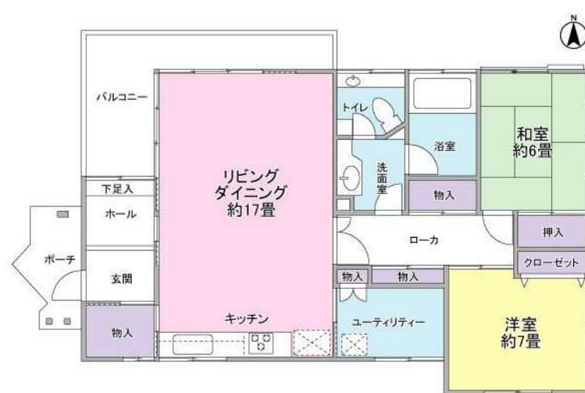
※図面と現況が異なる場合は現況を優先します。